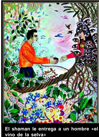
El shaman le entrega a un hombre «el vino de la selva»

«Otros síntomas muy importantes son los que denominamos deficitarios o negativos: abulia, aplanamiento afectivo, falta de interés en el entorno y desorganización del pensamiento», enumera Cetkovich-Bakmas.