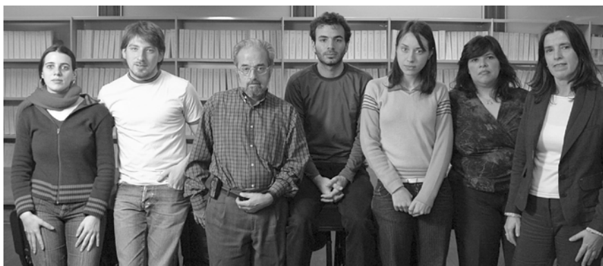
El equipo que está organizando el archivo de fotografías

El Programa de Historia de la Facultad de Ciencias Exactas y Naturales y la Biblioteca Luis Leloir están creando un registro visual de Exactas desde su creación. Los integrantes del grupo que lo impulsa esperan que graduados, profesores y estudiantes acerquen imágenes que serán preservadas en una sala especial.