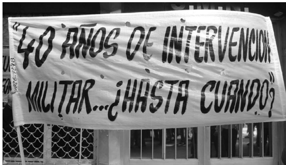
Una elocuente bandera que señala el espíritu de los reclamos