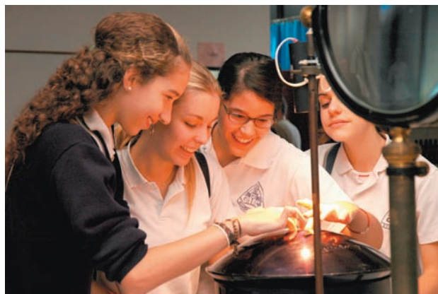
Estudiantes secundarias participaron de la Semana de la Física