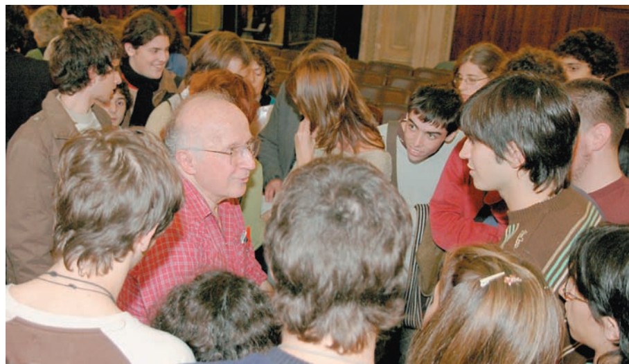
Roald Hoffmann rodeado de estudiantes secundarios

En su afán por establecer relaciones entre la ciencia y el arte, Hoffmann afirmó: “Estas estructuras sencillas tienen un sentido arquitectónico, parecen obras de arte. Pero también podemos construir moléculas de complejidad similar a la de la hemoglobina”.