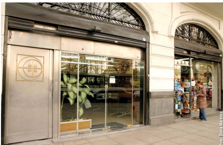
Sede y local de ventas de Eudeba, Av. Rivadavia 1573

- Lo que pasa es que hoy esas grandes cadenas compran centralizadamente y después deciden en qué locales ofrecen tu libro. Entonces vos vendiste 200 ejemplares pero resultó que los 200 te los des-parramaron en locales de todo el país.