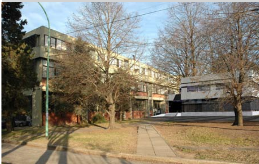
Vista simulada de la ampliación del Pabellón I, una de las obras previstas.

El Plan, con sus avances y definiciones, puede consultarse en http://exactas.uba.ar/plandeobras , donde también se incluyen imágenes simuladas de la fisonomía proyectada de la Facultad.