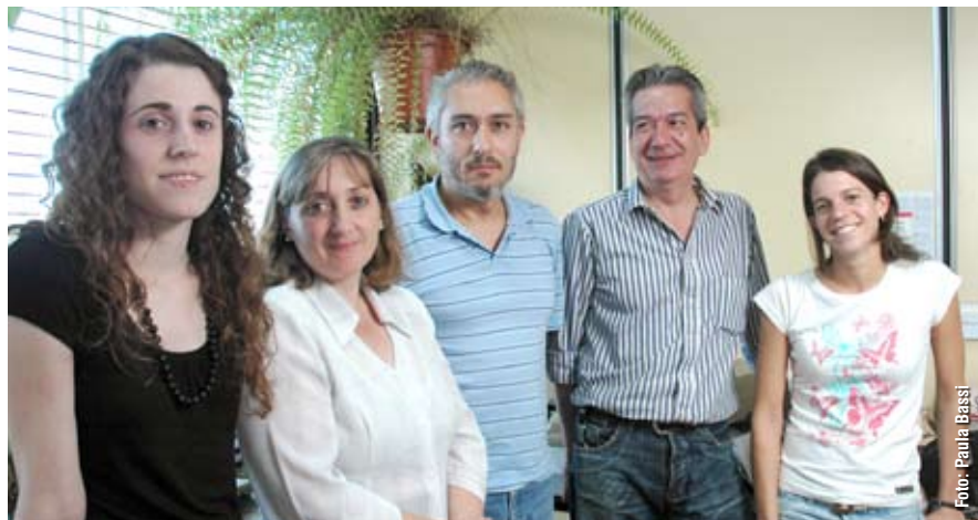
(De izq. a der.)