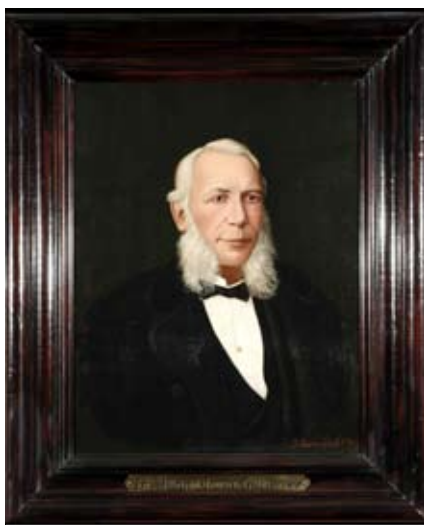
Juan María Gutiérrez