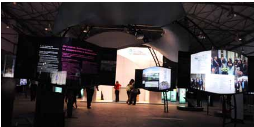
Argentina es el segundo país de Sudamérica en el que se presenta esta exhibición que ya fue visitada por más de 500 mil personas en todo el mundo. La muestra cuenta con 350 imágenes exclusivas, 150 videos y 50 exposiciones sobre un conjunto diverso de temas de investigación que se encuentran en la frontera del conocimiento actual.