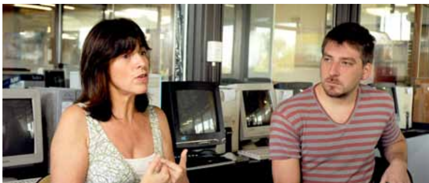
“En las últimas décadas se produjo un proceso de concentración del mercado editorial que generó que tres grandes editoriales agrupen el sesenta por ciento de las publicaciones de ciencia, tecnología y medicina. Esta situación, a su vez, provoca un constante aumento en los valores de las suscripciones”, describe Sanllorenti.

La Biblioteca es depositaria de alrededor de seiscientos tesis doctorales digitales que fueron entregadas desde el 2005,