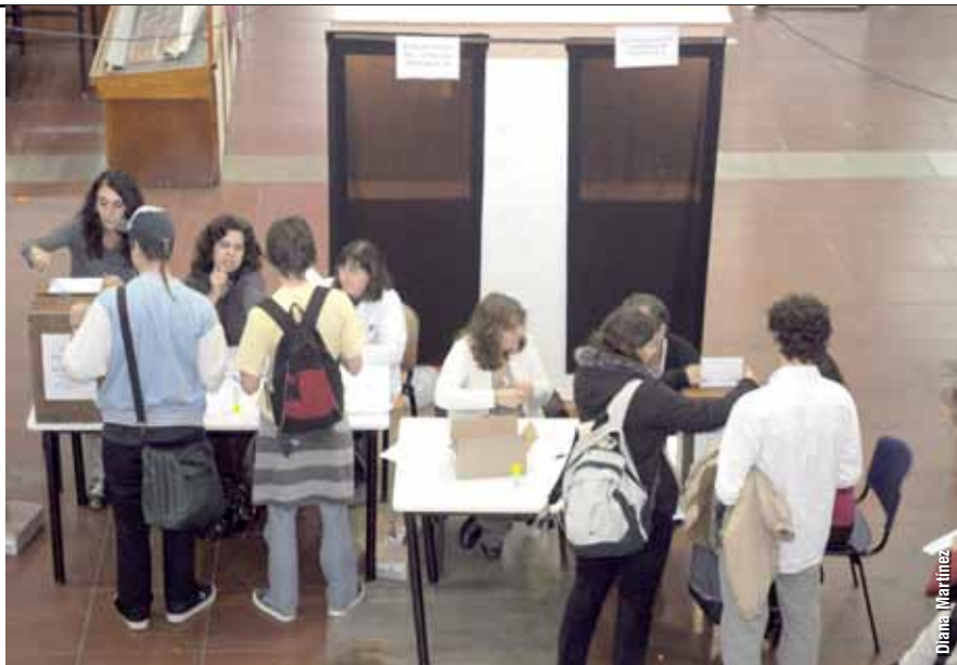
Una iniciativa de estas características requirió varias mesas electorales y una gran cantidad de autoridades de mesa. Y también fue necesario un gran esfuerzo en el momento del escrutinio: empezó a las nueve de la noche del viernes y terminó a las siete de la mañana del sábado, con la presencia de autoridades y militantes de agrupaciones de profesores, graduados, estudiantes y no docentes.

La minoría de graduados y estudiantes, que votó en contra de la sesión extraordinaria, había llevado al consejo un pro-