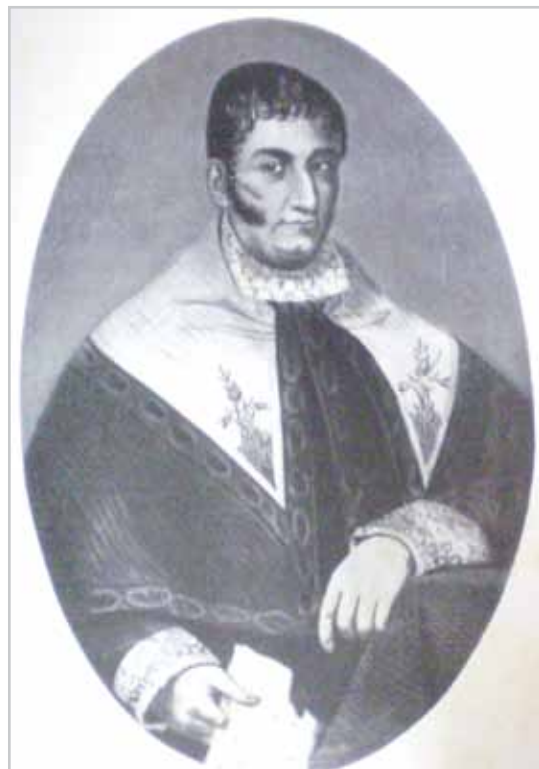
Sacerdote Antonio Sáenz, primer rector de la UBA.

Un mes antes de la fundación de la Universidad retornaba al país integrándose con el cargo de ministro Bernardino Rivadavia, que compartía con Sáenz la misma vocación modernizadora que los llevó a contratar profesores extranjeros y comprar laboratorios para el flamante Departamento de Ciencias Exactas de la Universidad de Buenos Aires. ▀