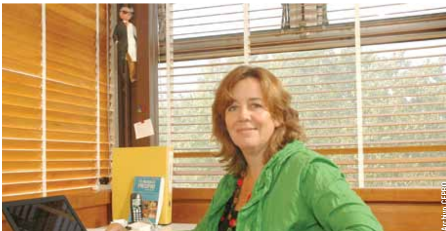
"Durante este año vamos a posicionar esta página en los buscadores con una política agresiva", propone Pregliasco y agrega, "deseamos mostrar el enorme potencial que puede encontrarse en Exactas, en un formato accesible, actualizado y amigable para nosotros mismos y para la sociedad toda".